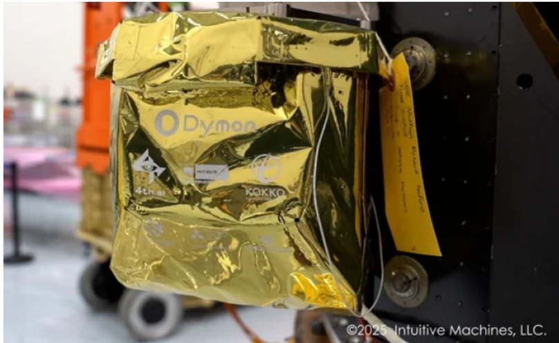
YAOKI 収納ケースの表面を覆うサーマルブランケットに印字されたパートナー企業のロゴマーク